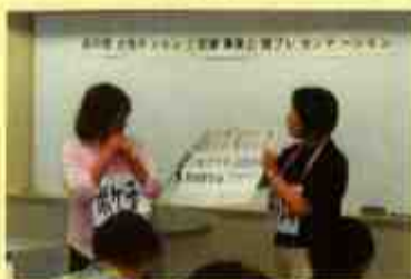
公開プレゼンテーション

女性のチャレンジに役立つ事業の公募を行い、応募のあった35団体(個人含む)・43企画のうち、公開プレゼンテーションを経て、8団体が決まりました。8団体は、それぞれが県民向けの事業を実施。各事業には、定員を超える応募がありました。事業への参加者とともに事業実施団体も、自身のもっている能力を最大限に生かせるよう、新たな発想で、様々な分野にチャレンジしています。