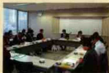
ネットワーク連絡会議