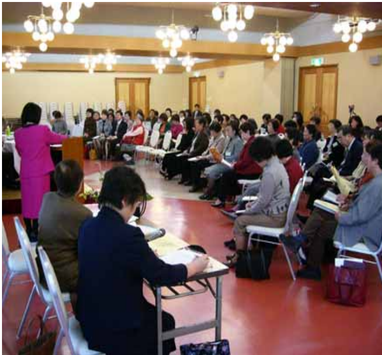
ちちぶ共同参画協議会