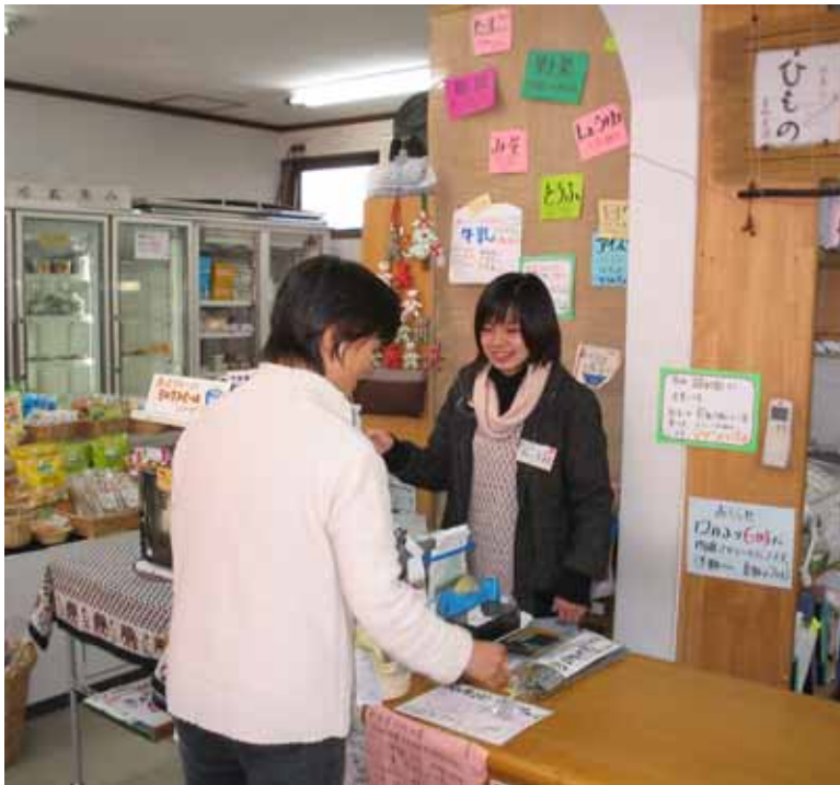
埼玉・コラボレーション・インスティテュート