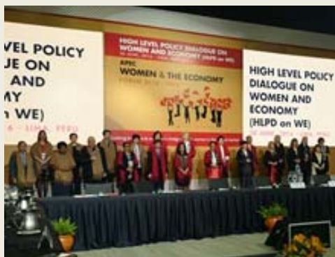
各エコノミーの代表によるフォトセッション