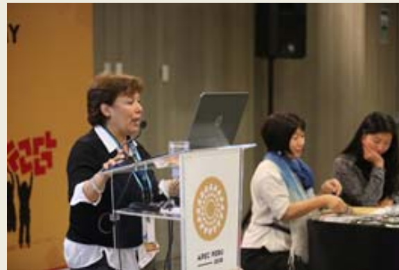
分科会セッション