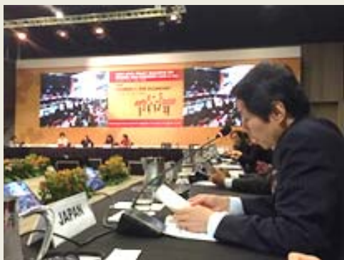
高木政務官によるスピーチ