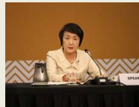
林横浜市長による基調講演