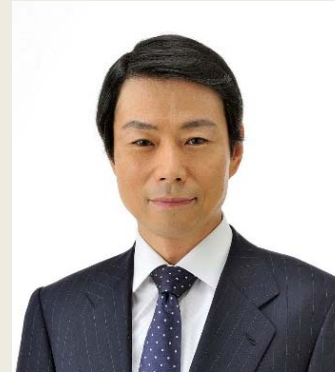
高木 宏壽 政務官