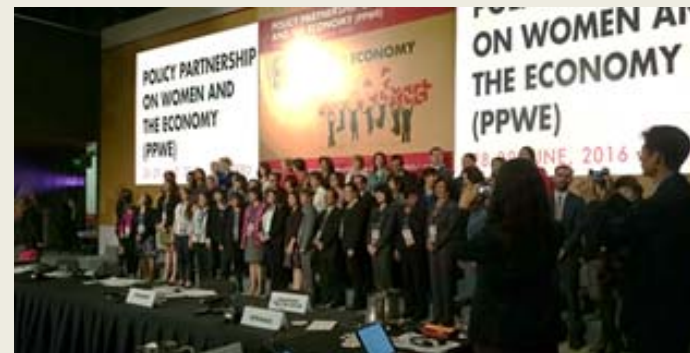
参加者によるフォトセッション