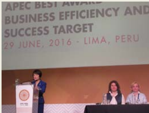
オープニングスピーチを行う林横浜市長

APEC域内における女性の起業の発展に対するマスメディア、実業界及び官界の関心を高めること等を目的とした表彰イベントが開催された。林横浜市長が開会挨拶を行った他、光畑氏がプレゼンテーションに参加。