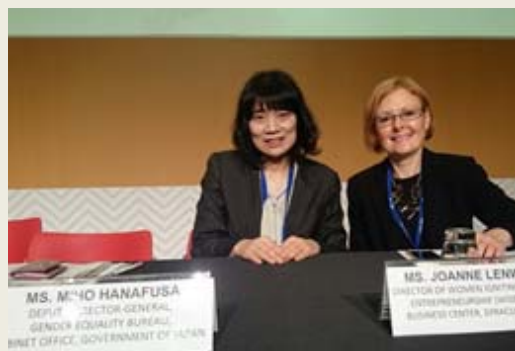
華房審議官による日本の発表