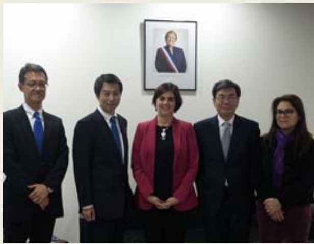
チリのパスクアル女性・ジェンダー平等大臣 左から2番目:高木政務官 中央:パスクアル大臣